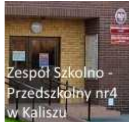
ZS-P NR 4 W KALISZU