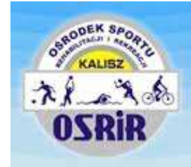
OSRIR W KALISZU