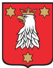
Miasto i Gmina Ostrzeszów