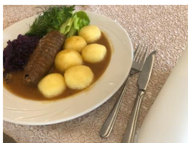
Rolada śląska , wędzony boczek, kiszony ogórek, cebula, kluski śląskie, czerwona kapusta