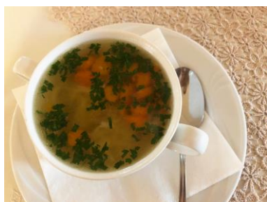
Rosół z makaronem