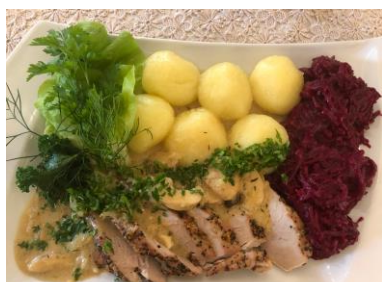
Polędwica wieprzowa w borowikach w śmietanie, kluski śląskie, buraczki na ciepło